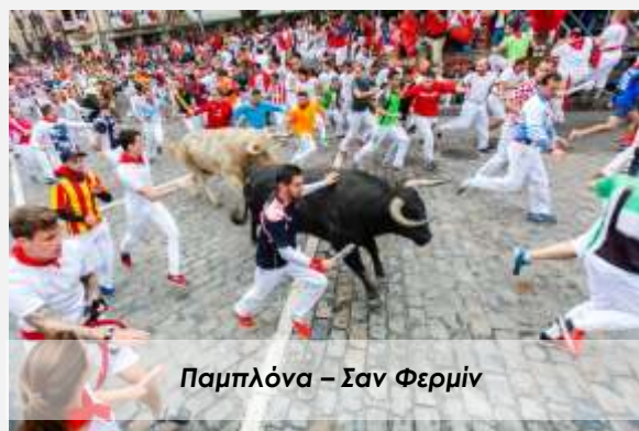
Παμπλόνα – Σαν Φερμίν