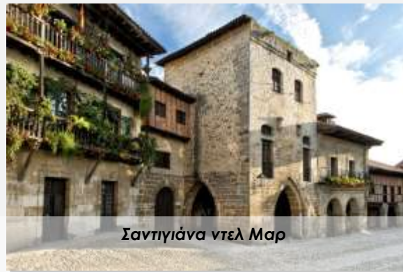
Σαντιγιάννα ντελ Μαρ

Η πόλη της Παμπλόνα είναι παγκοσμίως γνωστή για το φεστιβάλ του Σαν Φερμίν , ή των « ταυροδρομιών » όπως επίσης λέγεται, που θα έχουμε σήμερα την ευκαιρία να παρακολουθήσουμε και εμείς. Πρόκειται για μία από τις πιο δημοφιλείς τοπικές γιορτές σε όλη την Ισπανία, ένα θέαμα που συγκεντρώνει τόσο κόσμο ώστε η Παμπλόνα, μια πόλη περίπου 200.000 κατοίκων, να διπλασιάζει τον πληθυσμό της στις μέρες των εορτασμών – και σχεδόν να τον τριπλασιάζει μέσα στο σαββατοκύριακο!