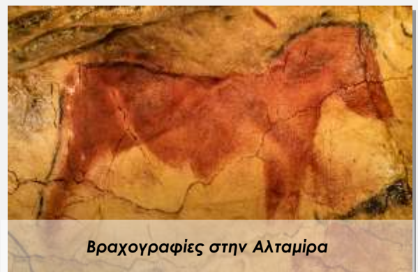
Βραχογραφίες στην Αλταμίρα