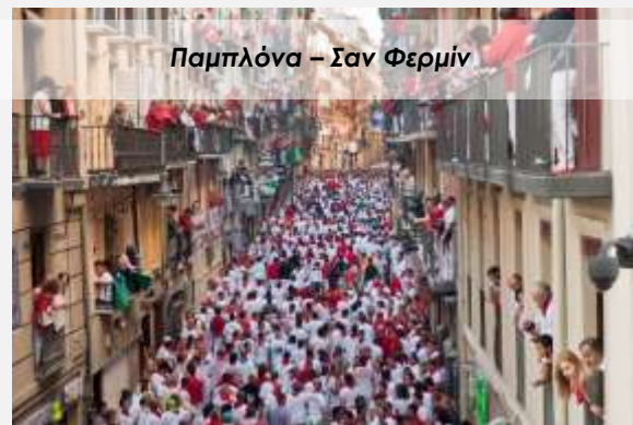
Παμπλόνα – Σαν Φερμίν