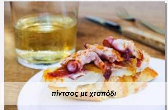
πίντσος με χταπόδι