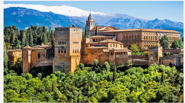
Ανάκτορο της Αλάμπρα - Γρανάδα