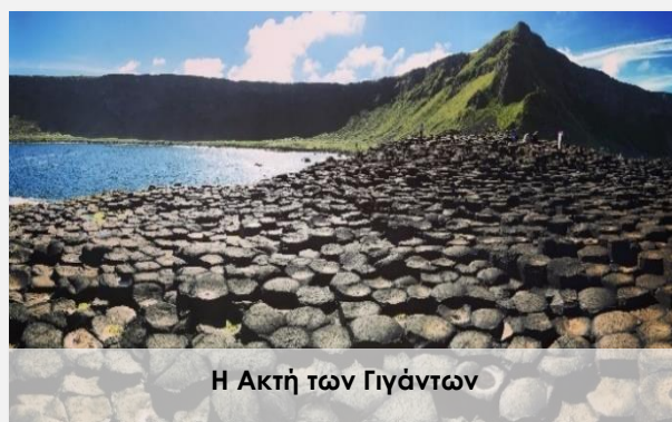
Η Ακτή των Γιγάντων