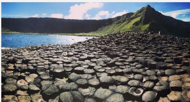
Η Ακτή των Γιγάντων