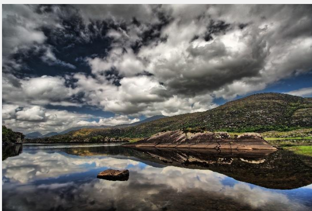
Δαχτυλίδι του Κέρυ