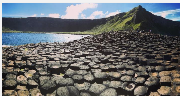
Η Ακτή των Γιγάντων