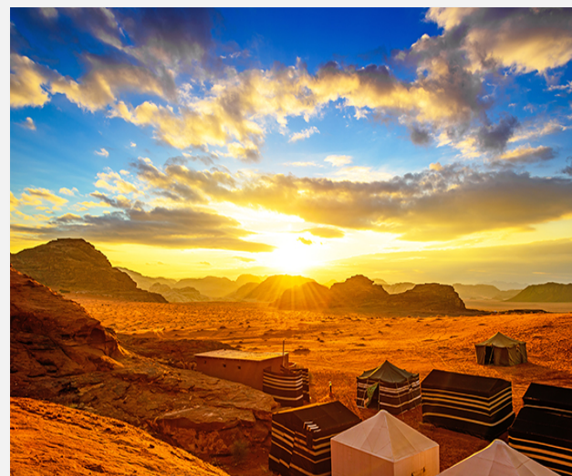
Ανατολή στο Ουάντι Ραμ