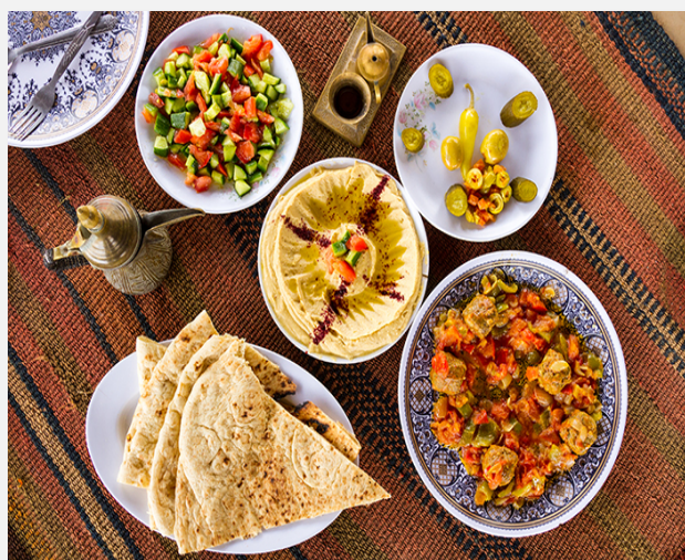
Παραδοσιακά πιάτα Ιορδανίας