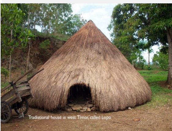
Traditional house in west Timor, called Lopo