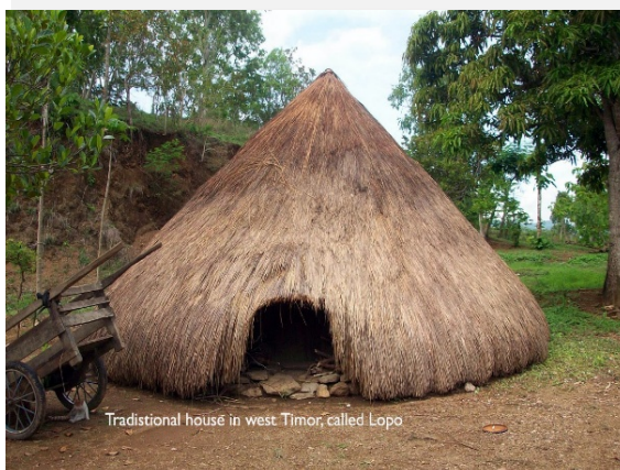
Tradistional house in west Timor, called Lopo