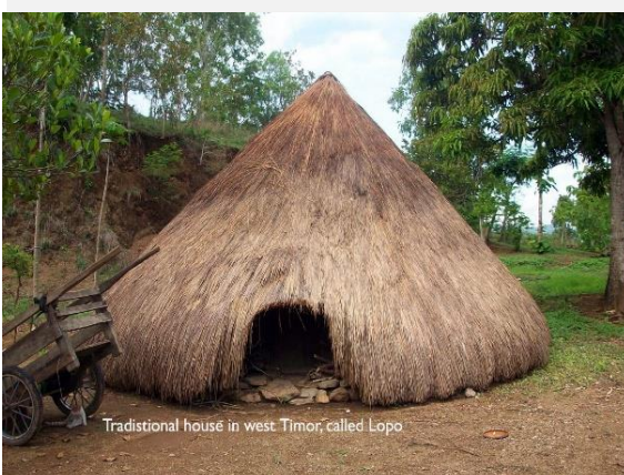
Traditional house in west Timor called Lopo