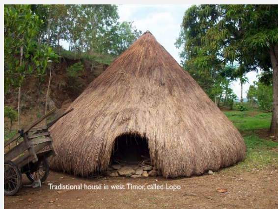
Traditional house in west Timor, called Lopo