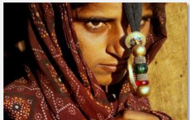
Στα χωριά των τοπικών φυλών