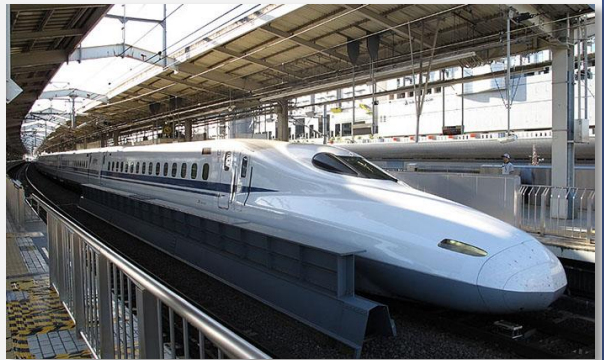
Τρένο βολίδα (σταθμός Κυτό)

Από το σταθμό του Κυτό, θα μεταβούμε με πούλμαν στην Odawara και μετά στο θέρετρο Hakone , στους πρόποδες του όρους Fuji, γνωστό εξαιτίας των θερμών πηγών του. Θα κάνουμε πρώτα μια σύντομη κρουαζιέρα στη λίμνη Άσι, και θα οδηγηθούμε στη βάση του τελεφερίκ που θα μας ανεβάσει στην περίφημη Κοιλιάδα του Βρασμού, ή Ογουακουντάι. Εκεί η γεωθερμική δραστηριότητα είναι έντονη, και ανάλογα με την ένταση της επιτρέπεται ή απαγορεύεται από τις αρχές η είσοδος των επισκεπτών. Θα θαυμάσουμε τη θέα, και με το πούλμαν μας θα συνεχίσουμε στην περιοχή του Όσινο Χακάι. Είναι μια περιοχή με φυσικές πηγές και μικρές λίμνες, προερχόμενες από τους πάγους των βουνών που λιώνουν. Το νερό περνώντας μέσα από τους πορώδεις βράχους, καταλήγει μετά από πολλά χρόνια στις λίμνες του γραφικού αυτού χωριού, μαζί με θρύλους αιώνιας νεότητας για όποιον πει νερό από αυτές. Εκεί είναι και το καλύτερο σημείο θέασης του όρους Φούτζι, αρκεί ο καιρός να το επιτρέπει, ώστε τα σύννεφα να μην καλύπτουν τον