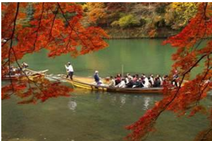
Βαρκάδα-εμπειρία ζωής στον ποταμό Hozugawa στην Αρασιγιάμα