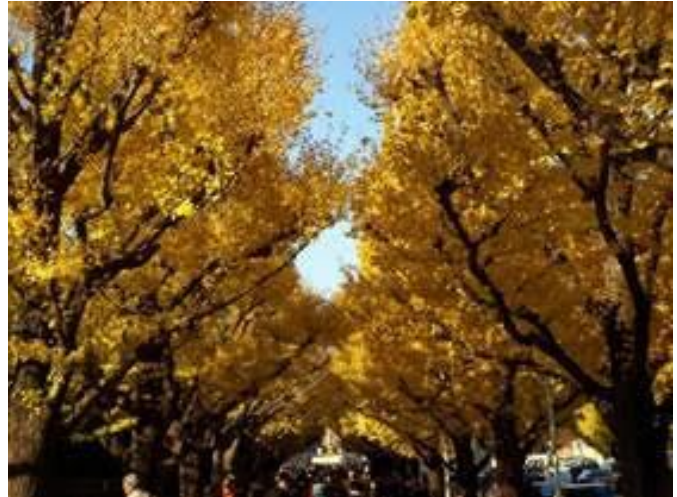
Έξω από το Maiji Shine