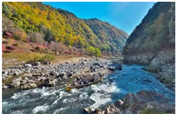
Βαρκάδα-εμπειρία ζωής στον ποταμό Hozugawa στην Αρασιγιάμα