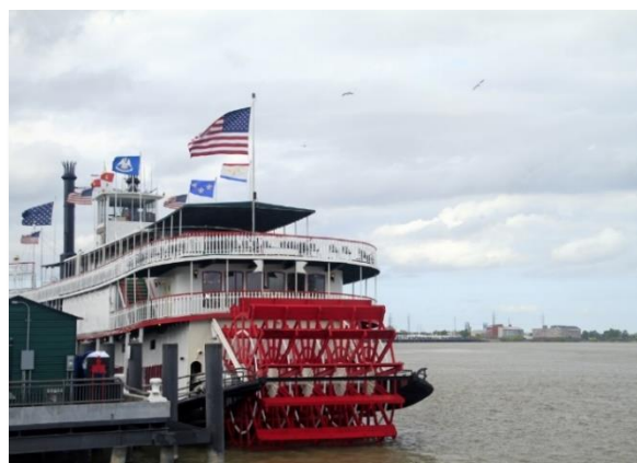
Ποταμόπλοιο εν ώρα «ανάπαυσης»