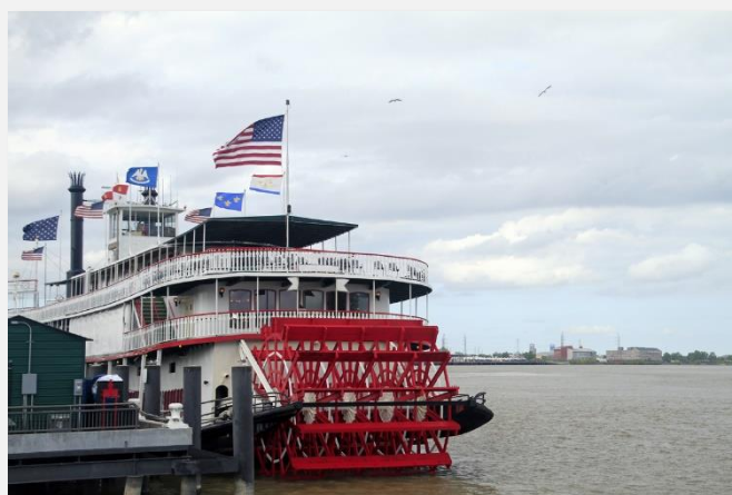
Ποταμόπλοιο εν ώρα «ανάπαυσης»