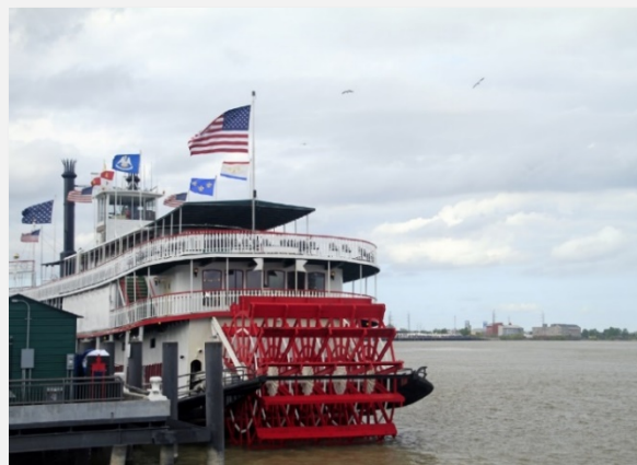
Ποταμόπλοιο εν ώρα «ανάπαυσης»