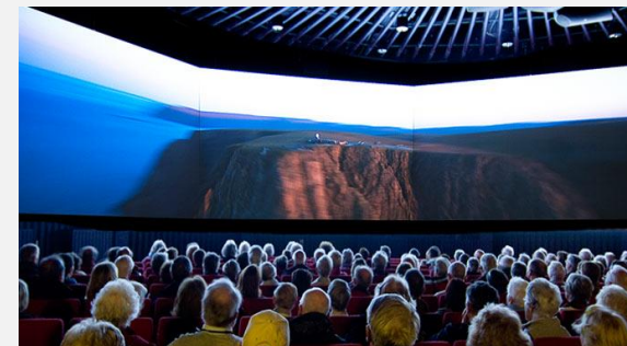
North Cape Hall