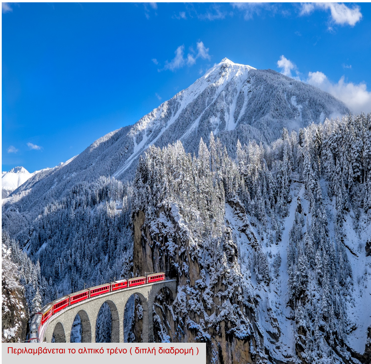
Περιλαμβάνεται το αλπικό τρένο ( διπλή διαδρομή )