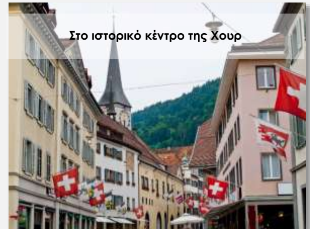
Στο ιστορικό κέντρο της Χουρ