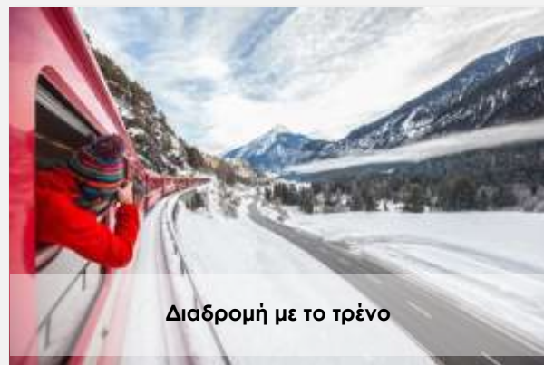
Διαδρομή με το τρένο