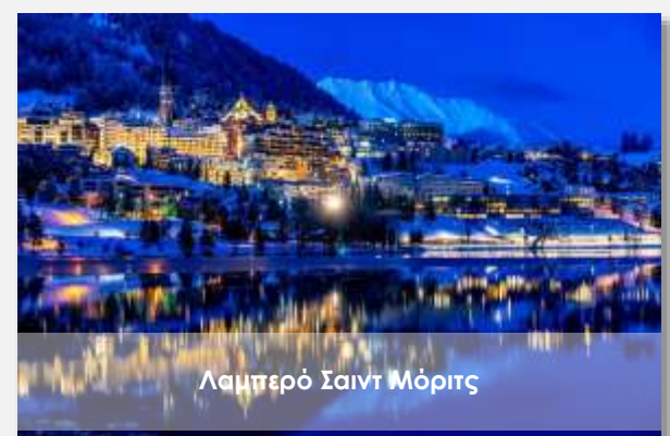
Λαμπερό Σαιντ Μόριτς