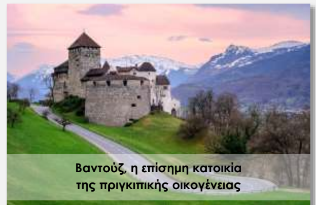
Βαντούζ, η επίσημη κατοικία της πριγκιπικής οικογένειας