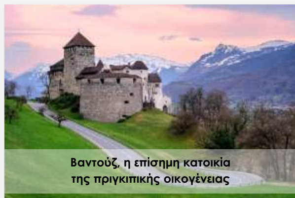
Βαντούζ, η επίσημη κατοικία της πριγκιπικής οικογένειας