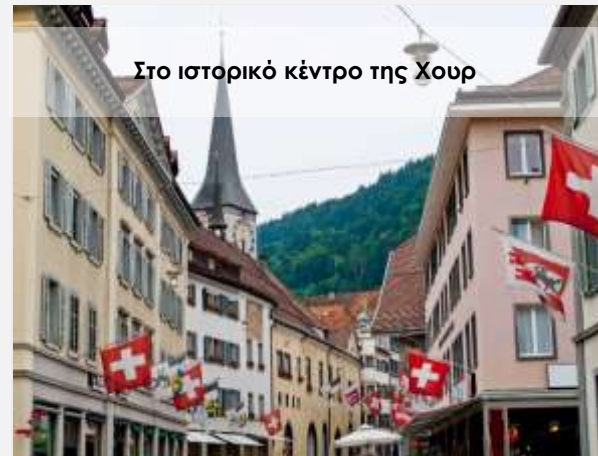
Στο ιστορικό κέντρο της Χουρ