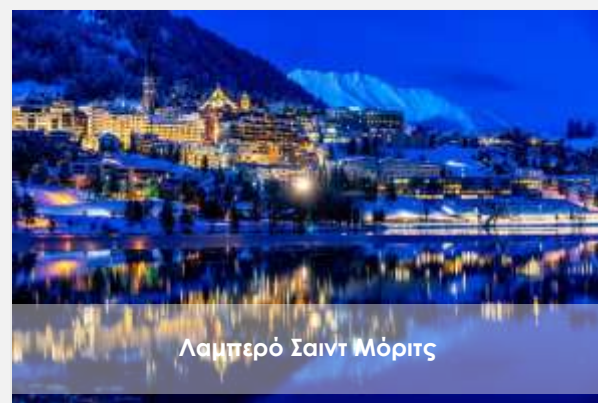
Λαμπερό Σαιντ Μόριτς