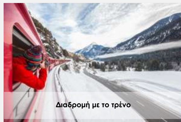
Διαδρομή με το τρένο