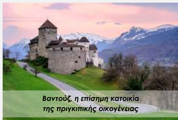
Βαντούζ, η επίσημη κατοικία της πριγκιπικής οικογένειας