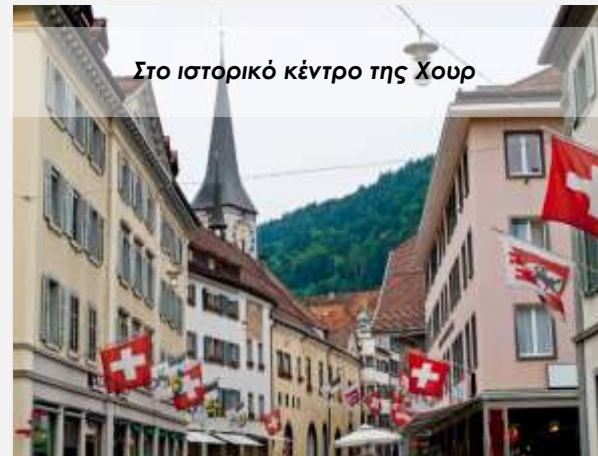
Στο ιστορικό κέντρο της Χουρ