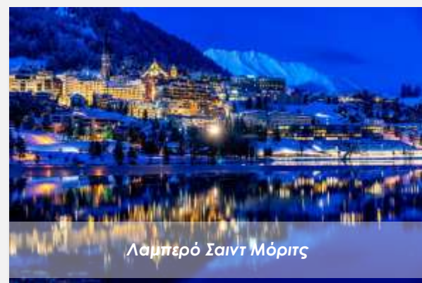
Λαμπερό Σαιντ Μόριτς