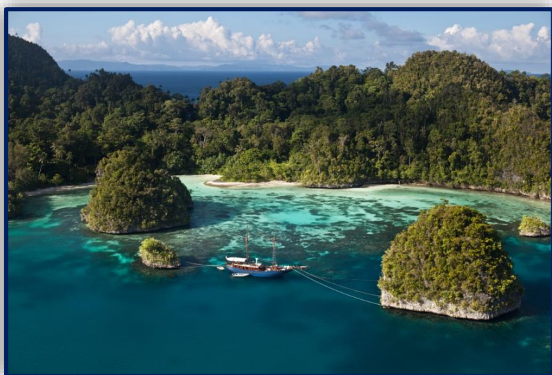
Προστατευόμενη παραλία στα νησιά Ράγια Αμπάτ στη Δυτική Παπούα

Μόνο το 18% ζει στις πόλεις. Στα χωράφια χρησιμοποιούν ακόμη εργαλεία της λίθινης εποχής και καλλιεργούν κοκοφοίνικες, αραχίδες, παπάγια, μανιόκα, καουτσούκ, φρούτα του πάθους, καφέ, κακάο... Επίσης, αναπτυγμένη είναι και η αλιεία μαργαριταριών. Από την άλλη οι κάτοικοι της Παπούα φημίζονται για τα ξυλόγλυπτά τους. Ορισμένα έχουν βρεθεί μέσω ιδιωτικών συλλογών στο Μουσείο Μοντέρνας Τέχνης της Νέας Υόρκης. Βεβαίως κάποιες από τις φυλές Παπούα επιδίονταν μέχρι πρόσφατα σε κανιβαλισμό και κυνήγι κεφαλών. Υπάρχουν ακόμη άνθρωποι μέσα στα δάση που έχουν δοκιμάσει ανθρώπινη σάρκα και μιλάνε γι αυτό.