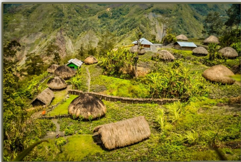
Παραδοσιακά σπίτια της φυλής Ντάνι σε χωριό στη Δυτική Παπούα