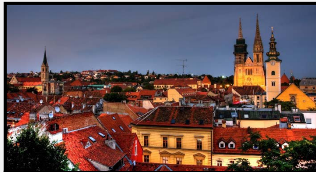
Ζάγκρεμπ Η πρωτεύουσα της Κροατίας

Θα αναχωρήσουμε για το παραθεριστικό κέντρο Μπλεντ με την πανέμορφη λίμνη του και το μοναδικό νησάκι της χώρας στο κέντρο της. Το όνομά του Bled (άστρο) είναι από την ομίχλη που εμφανίζεται κάθε πρωί ένα μέτρο πάνω από τη λίμνη. Θα επιβιβαστούμε σε πλοιάριο για μια μικρή βόλτα στα σμαραγδένια νερά της παραμυθένιας λίμνης Μπλεντ, όπου θα επισκεφθούμε το νησάκι της εκκλησίας της Παναγίας. Στη συνέχεια θα αναχωρήσουμε για την κοσμοπολίτικη Οπατία της Κροατίας. Η πόλη-θέρετρο από την εποχή της αυστρουογγρικής αυτοκρατορίας η «Νίκαια της Αδριατικής», είναι κτισμένη μέσα σε κήπους με ροδοδάφνες και μπουκαμβίλιες. Άφιξη και τακτοποίηση στο ξενοδοχείο μας. Διανυκτέρευση.