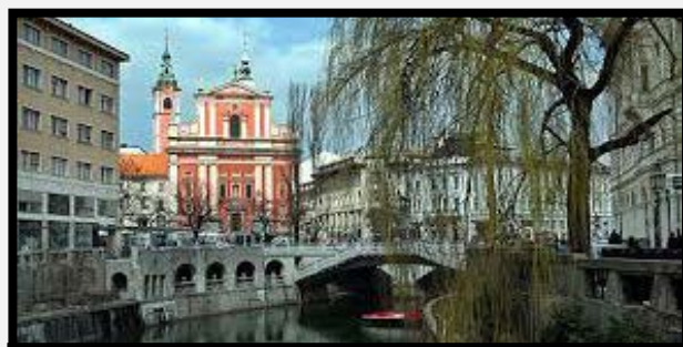
Λουμπλιάνα Η πρωτεύουσα της Σλοβενίας με την κουκλίστικη Παλιά Πόλη και το στενό ποτάμι που ελίσσεται ναυαγικά ανάμεσα στα