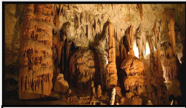
Τα μεγαλοπρεπή Σπήλαια της Ποστόινα