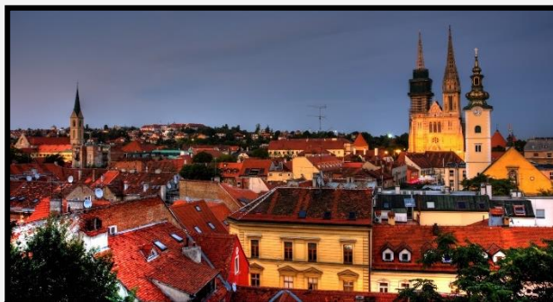
Ζάγκρεμπ Η πρωτεύουσα της Κροατίας

Θα αναχωρήσουμε για το παραθεριστικό κέντρο Μπλεντ με την πανέμορφη λίμνη του και το μοναδικό νησάκι της χώρας στο κέντρο της. Το όνομά του Bled (άσπρη) είναι από την ομίχλη που εμφανίζεται κάθε πρωί ένα μέτρο πάνω από τη λίμνη. Θα επιβιβαστούμε σε πλοiάριο για μια μικρή βόλτα στα σμαραγδένια νερά της παραμυθένιας λίμνης Μπλεντ, όπου θα επισκεφθούμε το νησάκι της εκκλησίας της Παναγίας. Στη συνέχεια, θα μεταβούμε στο εκπληκτικό κάστρο της πόλης, απ' όπου θα απολαύσουμε τη μαγευτική θέα της λίμνης ανάμεσα στις βουνοκορφές των Άλπεων και μετά θα αναχωρήσουμε για την κοσμοπολίτικη Οπατία της Κροατίας. Η πόλη-θέρετρο από την εποχή της αυστροουγγρικής αυτοκρατορίας η «Νίκαια της Αδριατικής», είναι κτισμένη μέσα σε κήπους με ροδοδάφνες και μπουκαμβίλιες. Άφιξη και τακτοποίηση στο ξενοδοχείο μας. Διανυκτέρευση.