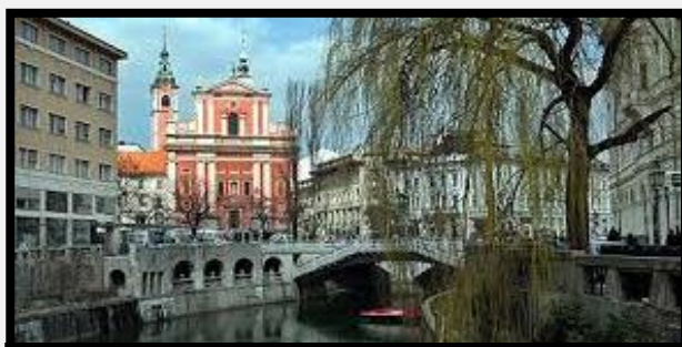
Λουμπλιάνα Η πρωτεύουσα της Σλοβενίας με την κουκλίστικη Παλιά Πόλη και το στενό ποτάμι που ελίσσεται νωχελικά ανάμεσα στα