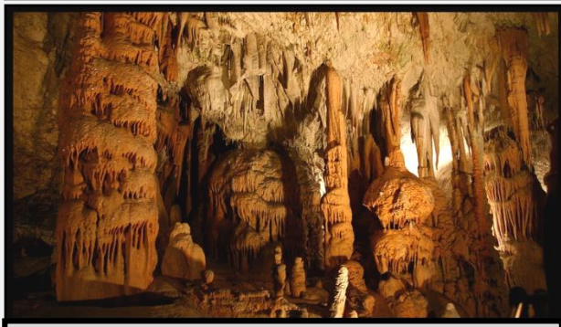
Τα μεγαλοπρεπή Σπήλαια της Ποστόινα