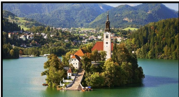
Λίμνη Μπλεντ το "Παραμυθένιο Νησί" και το εκπληκτικό κάστρο του Μπλεντ με τη μαγευτική θέα