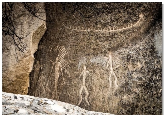
Βραχογραφίες στο Γκομπουστάν