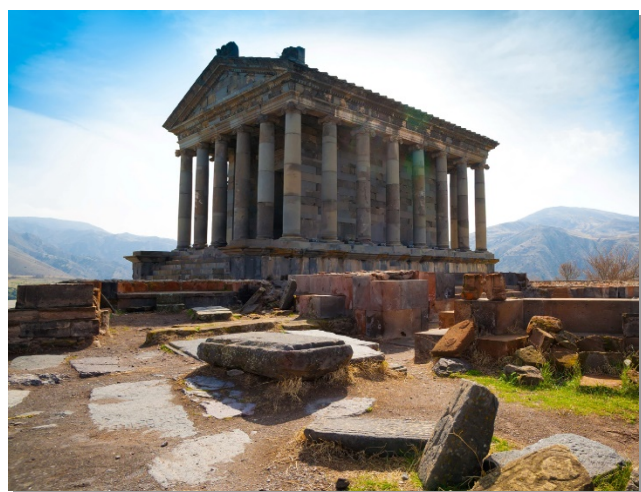
Στα βουνά της Αρμενίας...