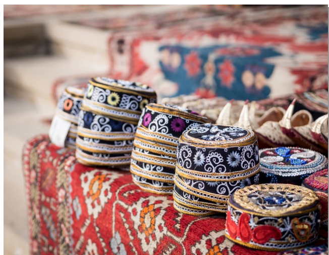
Λαϊκή αγορά στο Αζερμπαϊτζάν