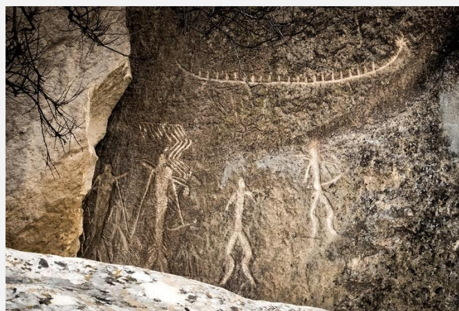
Βραχογραφίες στο Γκομπουστάν