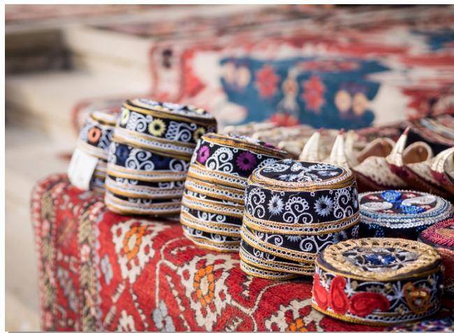
Λαϊκή αγορά στο Αζερμπαϊτζάν