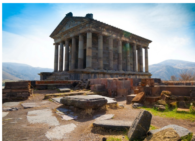
Στα βουνά της Αρμενίας...