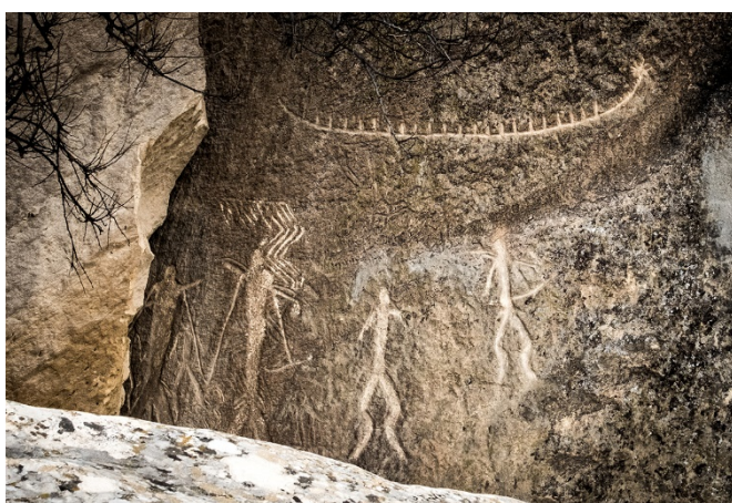
Βραχογραφίες στο Γκομπουστάν