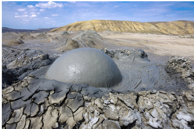
Ηφαιστεια λάσπης στο Γκομπουστάν

Επόμενος σταθμός μας το Μοναστήρι Μπόντμπε, ένα ορθόδοξο μοναστήρι του 9ου αιώνα, πριν φτάσουμε εντέλει στην πρωτεύουσα της Γεωργίας (ή Σακαρτβέλο, όπως ονομάζουν τη χώρα τους οι κάτοικοί της), την Τιφλίδα, που στα γεωργιανά ονομάζεται Τμπιλίσι και σημαίνει «ζεστή πηγή». τακτοποίηση στο ξενοδοχείο μας και διανυκτέρευση.