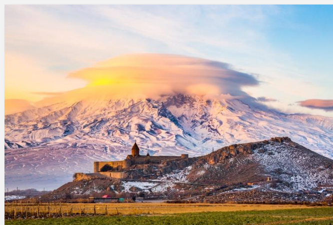
Μονή Χορ Βιράπ και στο βάθος το Αραράτ..