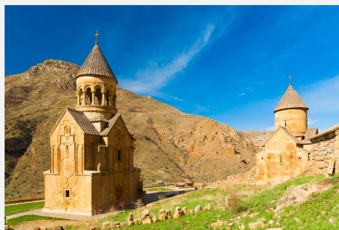
Μοναστήρι στα βουνά της Αρμενίας