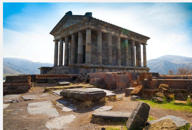
Στα βουνά της Αρμενίας...