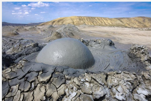
Ηφαιστεια λάσπη στο Γκομπουστάν

Επόμενος σταθμός μας το Μοναστήρι Μπόντμπε, ένα ορθόδοξο μοναστήρι του 9ου αιώνα, πριν φτάσουμε εντέλει στην πρωτεύουσα της Γεωργίας (ή Σακαρτβέλο, όπως ονομάζουν τη χώρα τους οι κάτοικοί της), την Τιφλίδα, που στα γεωργιανά ονομάζεται Τμπιλίσι και σημαίνει «ζεστή πηγή».