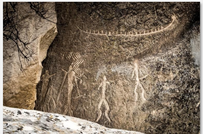
Βραχογραφίες στο Γκομπουστάν