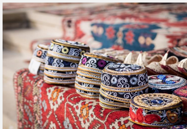
Λαϊκή αγορά στο Αζεμπαιτζάν