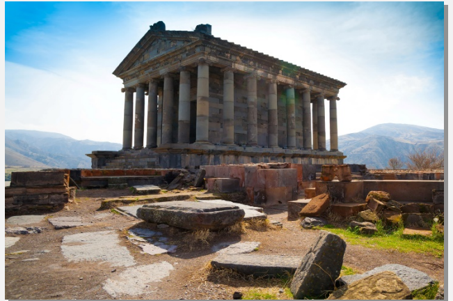
Στα βουνά της Αρμενίας...

Πρωινή αναχώρηση για την πόλη-μουσείο Μτσχέτα, πρωτεύουσα της Ιβηρίας (δηλ. της αρχαίας και μεσαιωνικής κεντρικής Γεωργίας), γνωστή για τις παλιές εκκλησίες Σβετσικοβέλι ("παλιά ρίζα") και Τζβάρι ("Τίμιος Σταυρός"), οι οποίες είναι ενταγμένες στον κατάλογο της Παγκόσμιας Κληρονομιάς της Ουνέσκο. Συνεχίζουμε για το Γκόρι, η γενέτειρα του Σοβιετικού ηγέτη Ιωσήφ Βησσαριόνοβιτς Τζουκασβίλι, γνωστότερου με το όνομα Στάλιν. Θα επισκεφθούμε το μουσείο του Στάλιν, όπου θα δούμε προσωπικά του αντικείμενα και θα γνωρίσουμε άγνωστες πτυχές της ζωής του. Στη συνέχεια θα κατευθυνθούμε στην περίφημη "λαξεμένη πόλη" Ουπλιστικέ, που είναι χτισμένη στην αριστερή όχθη του ποταμού Μκτβάρι. Επιστροφή στην Τιφλίδα. Τακτοποίηση στο ξενοδοχείο μας. Διανυκτέρευση.