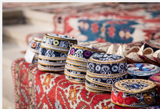
Σε παραδοσιακή αγορά στο Μπακού