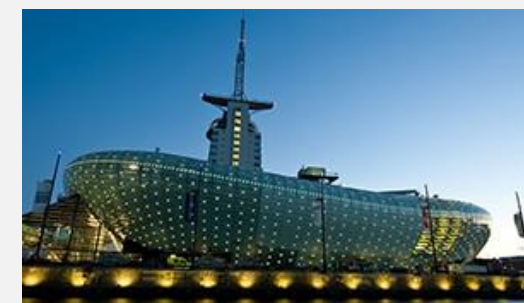
Μουσείο Κλίματος (Βρέμη)