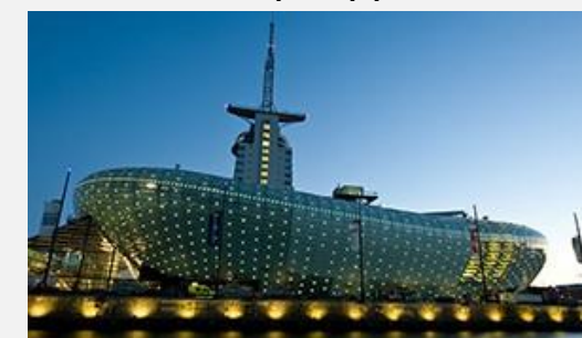
Μουσείο Κλίματος (Βρέμη)