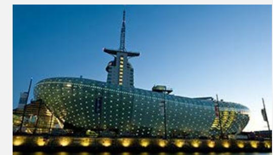
Μουσείο Κλίματος (Βρέμη)