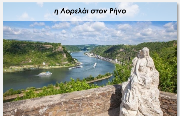
η Λορελάι στον Ρήνο