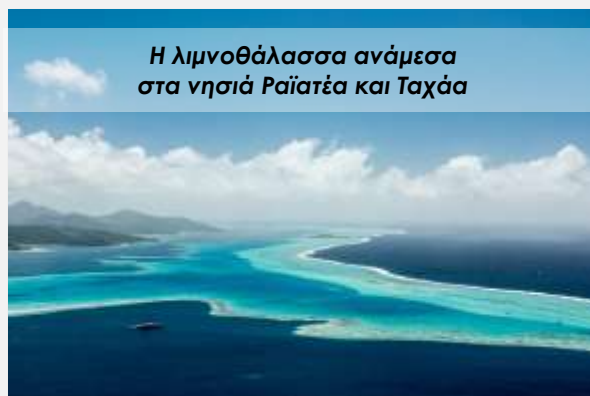
Η λιμνοθάλασσα ανάμεσα στα νησιά Ραϊατέα και Ταχαά