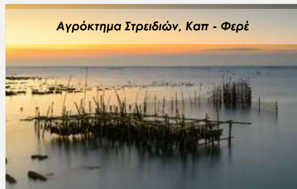
Αγρόκτημα Στρειδιών, Καπ - Φερέ