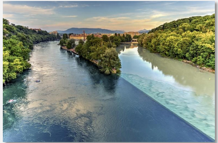
Η συμβολή του Ροδανού με τον ποταμό Αρβ, στη Γενεύη

Μια πόλη γεμάτη ζωή, όπως είναι η Λυών, έχει πολλά να μας αποκαλύψει, από τα μουσεία και τις γραφικές της πλατείες, μέχρι τα λιθόστρωτα καλντερίμια της και τα εξαιρετικά εστιατόρια και wine bars. Σήμερα θα ξεναγηθούμε στο ιστορικό κέντρο της Λυών, μνημείο Παγκόσμιας Πολιτιστικής Κληρονομιάς της UNESCO. Θα δούμε την πανοραμική θέα της πόλης, θα επισκεφθούμε τη συνοικία St. Jean Quartier, θα δούμε τη βασιλική της Notre Dame de la Fourviere και θα κάνουμε βόλτα στα περίφημα traboules της Λυών (τα