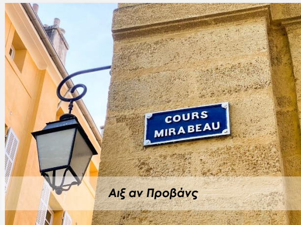
Αιξ αν Προβάνς

Το παραπάνω πρόγραμμα είναι ενδεικτικό. Το τελικό ενημερωτικό αποστέλλεται περίπου 3-5 ημέρες πριν από την εκάστοτε αναχώρηση.