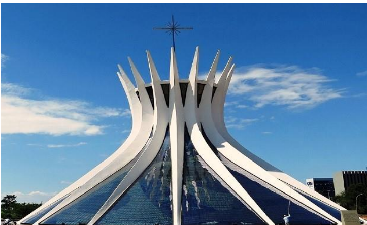
Ο καθεδρικός ναός της Μπραζιλία, Νόσα Σενιόρα Απαρεσίδα

Μεταξύ των νεότερων έργων του ξεχωρίζουν το Μουσείο Όσκαρ Νήμαγερ στη Κουριτίμπα (2002), ένα περίπτερο της Λονδρέζικης Σέρπεντιν Γκάλερυ (2003), και η αίθουσα συναυλιών στο Σάο Πάολο (2004). Βραβεύτηκε για το πρωτοποριακό του έργο με το βραβείο Πρίτσκερ και το 2004, με το ιαπωνικό βραβείο Πρέμιουμ Ιμπριάλε. Ο καθεδρικός ναός της Μπραζιλία, Νόσα Σενιόρα Απαρεσίδα, συγκαταλέγεται στα αριστουργήματα του Όσκαρ Νιεμαΐερ. 16 καμπύλοι στήλοι από μπετόν, οι οποίοι ενώνονται σε μια στέγη, συγκρατούν τον εξωτερικό σκελετό. Τρεις τεραστίων διαστάσεων άγγελιο μοιάζουν να αιωρούνται κάτω από τη στέγη του απείρπου εσωτερικού στρογγυλού ναού.