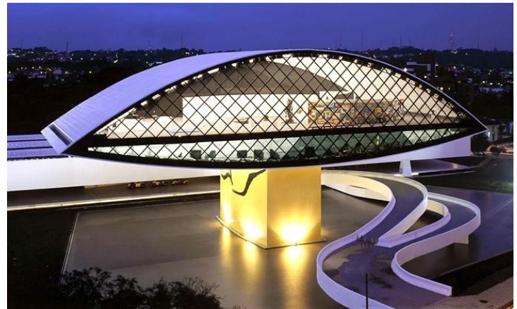
Μουσείο Όσκαρ Νήμαγερ στη Κουριτίμπα