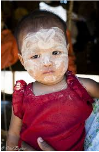
Χωριουδάκι Minnanthu Εντυπωσιακό το μακιγιάζ στα μικρά παιδιά