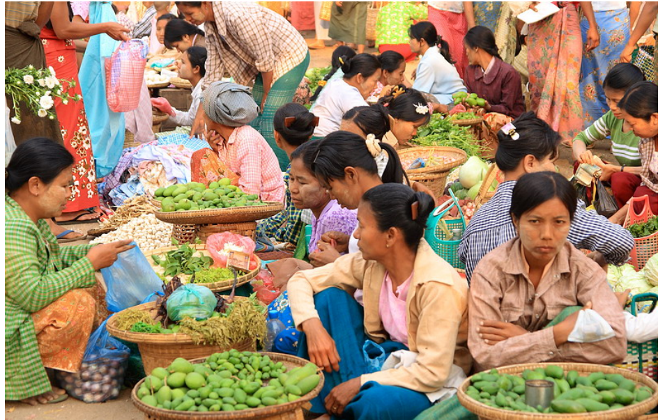
Παραδοσιακή αγορά Nyaung Uo. Μια πανδαισία χρωμάτων