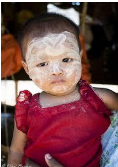
Χωριουδάκι Minnanthu Εντυπωσιακό το μακιγιάζ στα μικρά παιδιά.