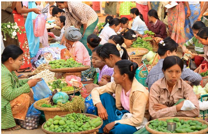
Παραδοσιακή αγορά Nyaung Οο. Πανδαισία χρωμάτων.