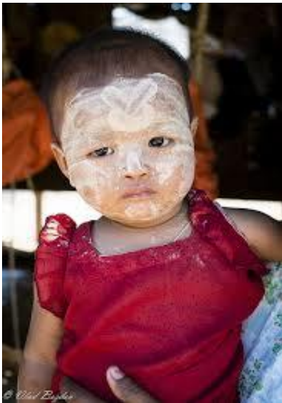
Χωριουδάκι Minpanthu Εντυπωσιακό το μακιγιάζ στα μικρά παιδιά.