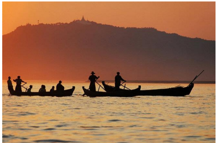
Εκτενής ξενάγηση στον αρχαιολογικό χώρο του Μπαγκάν.