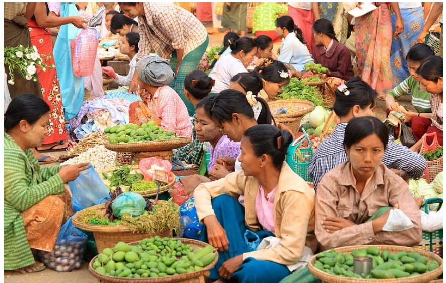
Παραδοσιακή αγορά Nyaung Οο. Πανδαισία χρωμάτων.