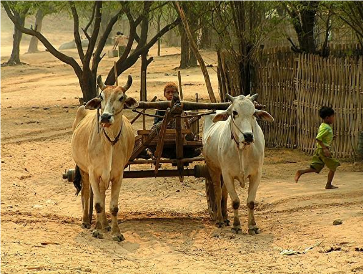
Χωριουδάκι Minnanthu Η βασική μετακίνηση είναι με βοϊδάμαξες

Οι καινοτομίες ενός από τα πιο επιτυχημένα προγράμματα του Versus Νέες επισκέψεις - εκδρομές που κάνουν αυτό το πρόγραμμα μοναδικό!