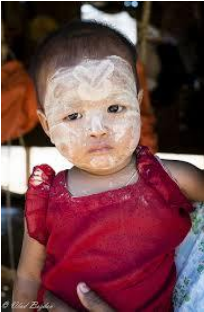
Χωριουδάκι Minnanthu Εντυπωσιακό το μακιγιάζ στα μικρά παιδιά