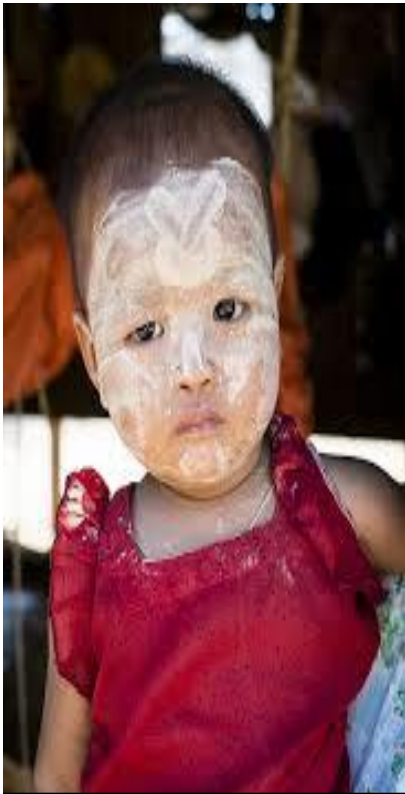
Χωριουδάκι Minnanthu Εντυπωσιακό το μακιγιάζ στα μικρά παιδιά