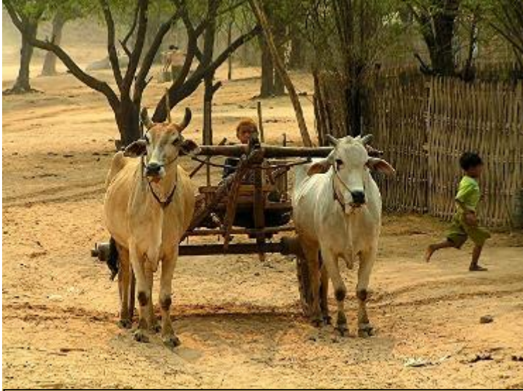
Χωριουδάκι Minnanthu Η βασική μετακίνηση είναι με βοϊδάμαξες

Δείπνο καλωσορίσματος στο Karaweik Royal Barge Restaurant, παρακολουθώντας φολκλορική παράσταση.