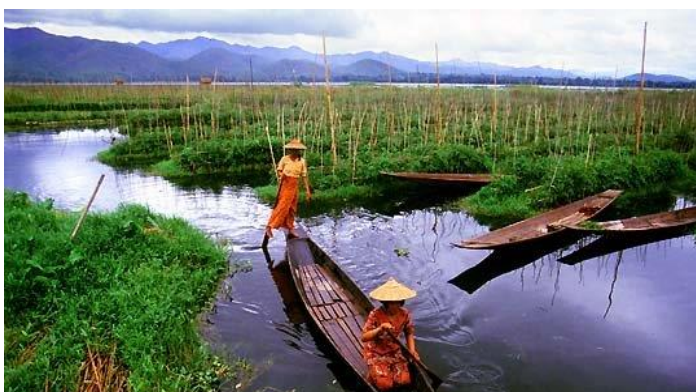
Εξονυχιστική επίσκεψη της Λίμνης Ίνλε και του εντυπωσιακού Indein και επίσκεψη σε χωριό με τις φυλές Ρα Ο