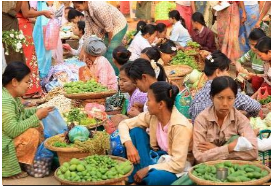
Παραδοσιακή αγορά Nyaung Οο. Μια πανδαισία χρωμάτων