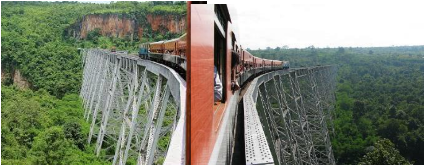
Διαδρομή με το διάσημο τρένο στην Πγιν Όο Λγουίν, όπου περνά πάνω από τη Viaduct Gokhteik, τη μεγαλύτερη σιδηροδρομική γέφυρα σε στύλους της εποχής της