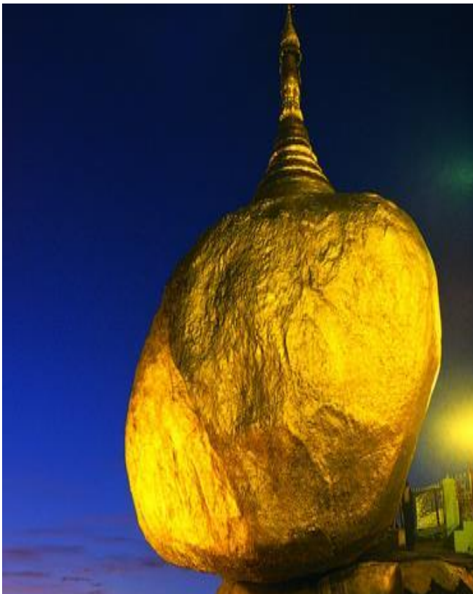
Επίσκεψη στον Golden Rock (Χρυσός Βράχος)

Χωριουδάκι Minnanthu Καπνίζοντας το παραδοσιακό τσιγάρο της Βιρμανίας, το cheerot, όπως το αποκαλούν οι ντόπιοι