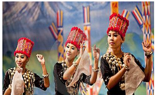
Δείπνο καλωσορίσματος στο Karaweik Royal Barge Restaurant, παρακολουθώντας φολκλορική παράσταση