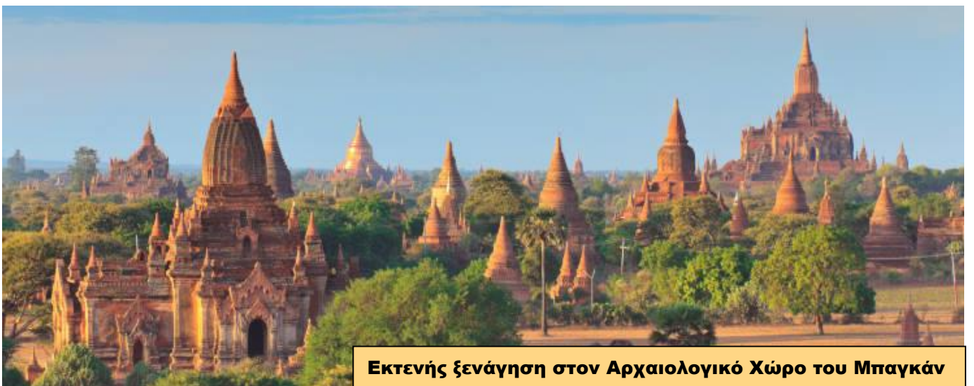
Εκτενής ξενάγηση στον Αρχαιολογικό Χώρο του Μπαγκάν