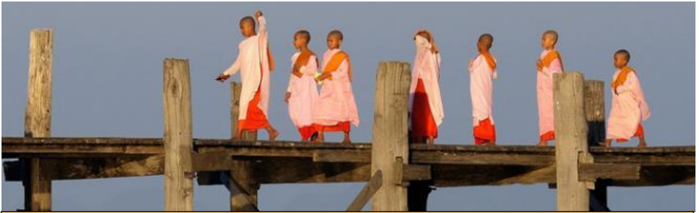
Κρουαζιέρα στο Μανταλέι, με τις σκηνές της καθημερινής ζωής των ανθρώπων της περιοχής να ξετυλίγονται μπροστά μας