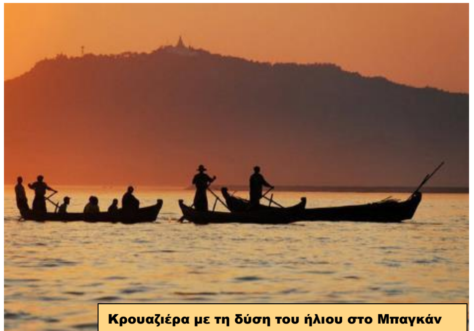
Κρουαζιέρα με τη δύση του ήλιου στο Μπαγκάν