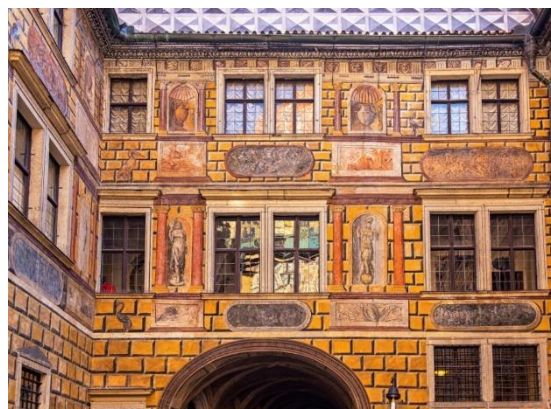
Οι ζωγραφισμένοι τοίχοι στα μεσαιωνικά σπίτια είναι κάτι σύνηθες στο Τσέσκυ Κρούμλοβ. Στη φωτογραφία βλέπουμε ζωγραφισμένο τοίχο του μεσαιωνικού κάστρου

Η προσωπικότητα όμως που δεσπάζει μοιραία στη γραφική αυτή πόλη είναι ο κορυφαίος αυστριακός ζωγράφος Έγκον Σίλε, ο οποίος θεωρείται ιδιοφυΐα της αρ νουβώ ζωγραφικής και είναι παγκοσμίως διάσημος για τα όλο ένταση πορτραίτα του – αγαπημένα θέματά του ήταν οι εταιρές των αρχών του 20ού αιώνα. Η μητέρα του καταγόταν από το