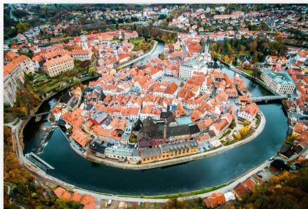
Πανοραμική άποψη της παλιάς πόλης στο Τσέσκυ Κρούμλοβ με τα μεσαιωνικά σπίτια, που σήμερα είναι ολόκληρη ένα μνημείο της UNESCO

Τσέσκυ Κρούμλοβ και ο ίδιος το επισκεπτόταν συχνά για διακοπές μεταξύ του 1907 και του 1917. Μάλιστα κάποια στιγμή αποφάσισε να μετακομίσει εκεί από τη Βιέννη για να εργαστεί αλλά δεν τα κατάφερε. Το πνεύμα του ήταν πολύ ανατρεπτικό και μποέμ για τη μικρή συντηρητική πόλη – την απεικόνισε σε μία σειρά έργων υπό τον τίτλο «Νεκρή Πόλη» – κι έτσι αναγκάστηκε να την εγκαταλείψει άρον άρον, για την κοσμοπολίτικη και πιο καλλιτεχνική Βιέννη. Σήμερα στο Τσέσκυ Κρούμλοβ διατηρείται το πατρικό σπίτι της μητέρας του στο όπου έμενε και ζωγράφιζε ο ίδιος, στην οδό Πλέςιβετς Νο. 343 πάνω στο ποτάμι. Εκεί στεγάζεται πλέον ένα μουσείο αφιερωμένο στο έργο του. Ο Σίλε πέθανε το 1918 έναν χρόνο αφότου εγκατέλειψε το Τσέσκυ Κρούμλοβ, από ισπανική γρίπη στη Βιέννη, λίγο προτού κλείσει τα 28 χρόνια του. Σήμερα έργα του εκτίθενται στα μεγαλύτερα μουσεία όλου το κόσμου. Σήμερα έργα του εκτίθενται στα μεγαλύτερα μουσεία όλου το κόσμου.