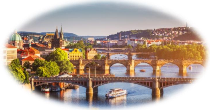
Η πανέμορφη παλιά πόλη της Πράγας, μνημείο της UNESCO, πάνω στον ποταμό Μολδάβα

Ακόμα κι αν δεν έχεις πάει στην Πράγα, σίγουρα έχεις μία εικόνα της. Έχεις δει σε φωτογραφίες τις χρυσές στέγες της. Έχεις δει τα παράξενα γοτθικά κτήρια με τα τερατόμορφα στολίδια που δεν καταλαβαίνεις αν σχεδιάστηκαν από τους αρχιτέκτονες πριν αιώνες για να τρομοκρατούν τους περαστικούς ή για να χλευάσουν την καταπίεση της Αγίας Ρωμαϊκής Αυτοκρατορίας. Επίσης ξέρεις από την Πράγα το Μαύρο Θέατρο, τον Κάφκα, τον Κούντερα. Και βέβαια έχεις ακουστά την Άνοιξη της Πράγας και τη Βελούδινη Επανάσταση... Όλα αυτά δεν είναι λίγα. Όλα αυτά, μαζί με ό,τι πούμε παρακάτω για τη γοητευτική αυτή πρωτεύουσα της Τσεχίας, δείχνουν ότι η Πράγα είναι μία πόλη που ανά τους αιώνες χορεύει με την ιστορία – και μάλιστα διαλέγει μόνη της τα βήματα αυτού του χορού.