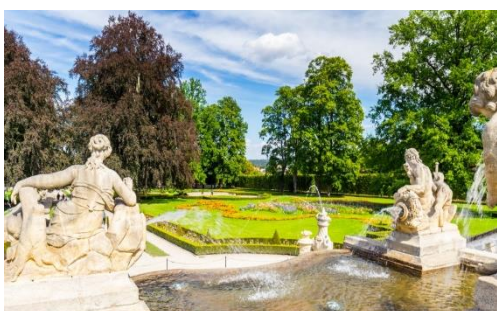
Οι κήποι του κάστρου στο Τσέσκυ Κρούμλοβ είναι γεμάτοι με λίμνες, αγάλματα και κατά παράδοση... μικρές αρκούδες

Η πόλη και το κάστρο της χτίστηκαν στα τέλη του 13ου αιώνα σε ένα εμπορικής σημασίας πέρασμα του Μολδάβα. Εξ ου και ο πλούτος της μικρής αυτής πόλης που φαίνεται ξεκάθαρα στην εντυπωσιακή αρχιτεκτονική της. Ορόσημο είναι το επιβλητικό κάστρο της, το δεύτερο μεγαλύτερο στην Τσεχία. Το κτιριακό συγκρότημα του κάστρου περιλαμβάνει τεράστιους κήπους, όπου κατά παράδοση ζουν μικρές αρκούδες, λίμνες, τάφρο και ένα υπέροχο μπαρόκ θέατρο, που χτίστηκε το 1682. Λόγω παλαιότητας εκεί δίνονται μόνο δύο παραστάσεις μπαρόκ