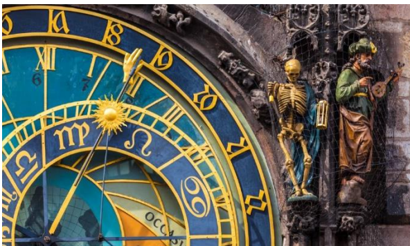
Λεπτομέρεια της παράξενης αρχιτεκτονικής της Πράγας που συμβαδίζει με την πλούσια ιστορίας της. Ένας σκελετός κοσμεί το Αστρονομικό Ρολόι της πόλης

Η πόλη άνθισε τον 14ο αιώνα, καθώς εξελίχθηκε σε σημαντικότατο εμπορικό κέντρο και προσέλκυε εμπόρους από όλη την Ευρώπη. Τότε ενισχύθηκε εκεί και το έντονο εβραϊκό στοιχείο που χαρακτηρίζει την Πράγα και την κουλτούρα της. Μνημεία της εποχής αυτής είναι και ο Καθεδρικός του Αγίου Βίτου μέσα στο κάστρο Χράντσανι, ο παλαιότερος γοτθικός καθεδρικός ναός στην κεντρική Ευρώπη, καθώς και το Πανεπιστήμιο, το παλαιότερο στην κεντρική Ευρώπη.