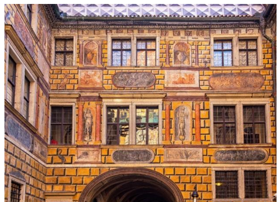
Οι ζωγραφισμένοι τοίχοι στα μεσαιωνικά σπίτια είναι κάτι σύνηθες στο Τσέσκυ Κρούμλοβ. Στη φωτογραφία βλέπουμε ζωγραφισμένο τοίχο του μεσαιωνικού κάστρου

Η προσωπικότητα όμως που δεσπάζει μοιραία στη γραφική αυτή πόλη είναι ο κορυφαίος αυστριακός ζωγράφος Έγκον Σίλε, ο οποίος θεωρείται ιδιοφυΐα της αρ νουβώ ζωγραφικής και είναι παγκοσμίως διάσημος για τα όλο ένταση πορτραίτα του – αγαπημένα θέματά του ήταν οι εταιρές των αρχών του 20ού αιώνα. Η μητέρα του καταγόταν από το