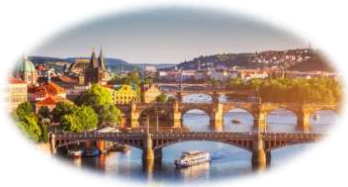
Η πανέμορφη παλιά πόλη της Πράγας, μνημείο της UNESCO, πάνω στον ποταμό Μολδάβα

Ακόμα κι αν δεν έχεις πάει στην Πράγα, σίγουρα έχεις μία εικόνα της. Έχεις δει σε φωτογραφίες τις χρυσές στέγες της. Έχεις δει τα παράξενα γοτθικά κτήρια με τα τερατόμορφα στολίδια που δεν καταλαβαίνεις αν σχεδιάστηκαν από τους αρχιτέκτονες πριν αιώνες για να τρομοκρατούν τους περαστικούς ή για να χλευάσουν την καταπίεση της Αγίας Ρωμαϊκής Αυτοκρατορίας. Επίσης ξέρεις από την Πράγα το Μαύρο Θέατρο, τον Κάφκα, τον Κούντερα. Και βέβαια έχεις ακουστά την Άνοιξη της Πράγας και τη Βελούδινη Επανάσταση... Όλα αυτά δεν είναι λίγα. Όλα αυτά, μαζί με ό,τι πούμε παρακάτω για τη γοητευτική αυτή πρωτεύουσα της Τσεχίας, δείχνουν ότι η Πράγα είναι μία πόλη που ανά τους αιώνες χορεύει με την ιστορία – και μάλιστα διαλέγει μόνη της τα βήματα αυτού του χορού.