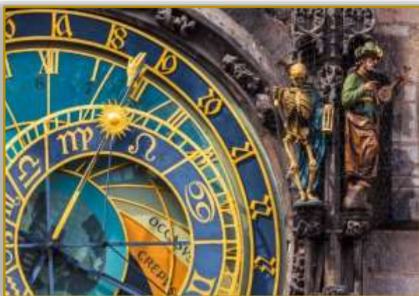
Λεπτομέρεια της παράξενης αρχιτεκτονικής της Πράγας που συμβαδίζει με την πλούσια Ιστορία της: Ένας σκελετός κοσμεί το Αστρονομικό Ρολόι της πόλης

Η πόλη άνθισε τον 14ο αιώνα, καθώς εξελίχθηκε σε σημαντικότερο εμπορικό κέντρο και προσέλκυε εμπόρους από όλη την Ευρώπη. Τότε ενισχύθηκε εκεί και το έντονο εβραϊκό στοιχείο που χαρακτηρίζει την Πράγα και την κουλτούρα της. Μνημεία της εποχής αυτής είναι και ο Καθεδρικός του Αγίου Βίτου μέσα στο κάστρο Χράντσανι, ο παλαιότερος γοτθικός καθεδρικός ναός στην κεντρική Ευρώπη, καθώς και το Πανεπιστήμιο, το παλαιότερο στην κεντρική Ευρώπη.