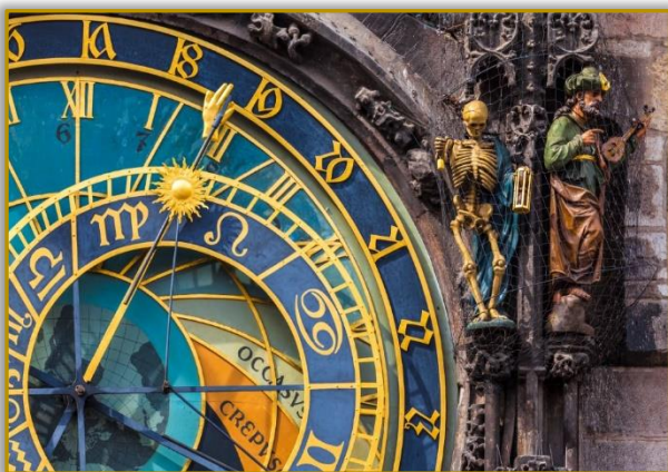
Λεπτομέρεια της παράξενης αρχιτεκτονικής της Πράγας που συμβαδίζει με την πλούσια Ιστορία της: Ένας σκελετός κοσμεί το Αστρονομικό Ρολόι της πόλης

Η πόλη άνθισε τον 14ο αιώνα, καθώς εξελίχθηκε σε σημαντικότερο εμπορικό κέντρο και προσέλκυε εμπόρους από όλη την Ευρώπη. Τότε ενισχύθηκε εκεί και το έντονο εβραϊκό στοιχείο που χαρακτηρίζει την Πράγα και την κουλτούρα της. Μνημεία της εποχής αυτής είναι και ο Καθεδρικός του Αγίου Βίτου μέσα στο κάστρο Χράντσανι, ο παλαιότερος γοτθικός καθεδρικός ναός στην κεντρική Ευρώπη, καθώς και το Πανεπιστήμιο, το παλαιότερο στην κεντρική Ευρώπη.