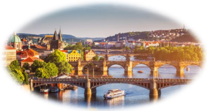
Η πανέμορφη παλιά πόλη της Πράγας, μνημείο της UNESCO, πάνω στον ποταμό Μολδάβα

Ακόμα κι αν δεν έχεις πάει στην Πράγα, σίγουρα έχεις μία εικόνα της. Έχεις δει σε φωτογραφίες τις χρυσές στέγες της. Έχεις δει τα παράξενα γοτθικά κτήρια με τα τερατόμορφα στολίδια που δεν καταλαβαίνεις αν σχεδιάστηκαν από τους αρχιτέκτονες πριν αιώνες για να τρομοκρατούν τους περαστικούς ή για να χλευάσουν την καταπίεση της Αγίας Ρωμαϊκής Αυτοκρατορίας. Επίσης ξέρεις από την Πράγα το Μαύρο Θέατρο, τον Κάφκα, τον Κούντερα. Και βέβαια έχεις ακουστά την Άνοιξη της Πράγας και τη Βελούδινη Επανάσταση... Όλα αυτά δεν είναι λίγα. Όλα αυτά, μαζί με ό,τι πούμε παρακάτω για τη γοητευτική αυτή πρωτεύουσα της Τσεχίας, δείχνουν ότι η Πράγα είναι μία πόλη που ανά τους αιώνες χορεύει με την ιστορία – και μάλιστα διαλέγει μόνη της τα βήματα αυτού του χορού.